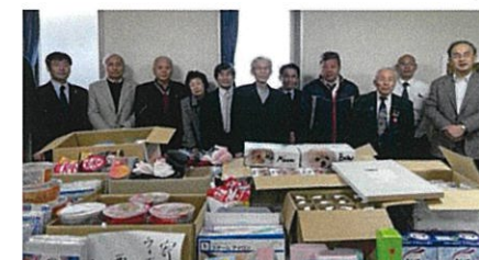
ウィズ広島へ物品の寄贈(協力組織部)12/17

コロナ禍の中 各部の活動は自粛せざるを得ませんでしたが、ウィズ広島への物品寄贈(今年は自転車をとの要望がありました)や、小学校での薬乱防止教室という恒例行事を行いました。又、ガストピアでの『えがお食堂』への参加をし、県更女に協力しての鮭の販売も、男性保護司が鮭の切り方担当で協力しました。