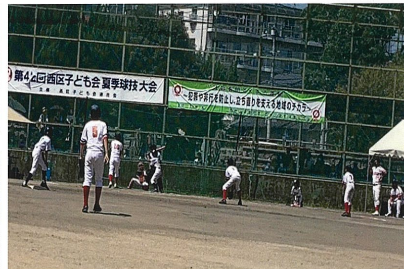
第42回 子ども会夏季球技大会 8/1