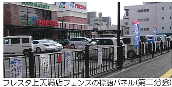
フレスタ上天満店フェンスの標語パネル(第二分会)