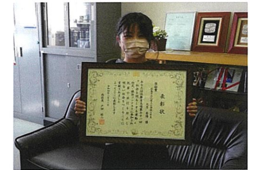
己斐上小学校校長室にて表彰状授与