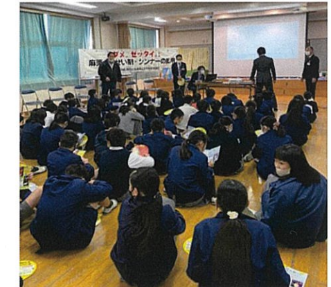
三篠小学校薬乱防止教室 11/9