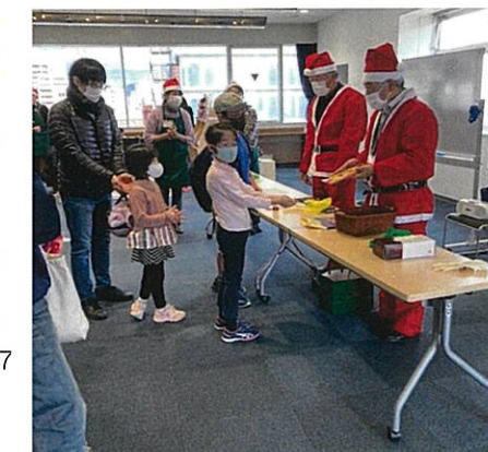
「ふるさと思いがお食堂」参加 クリスマス会 12/4