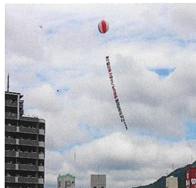
社明啓発アドバルーン(太田川放水路)