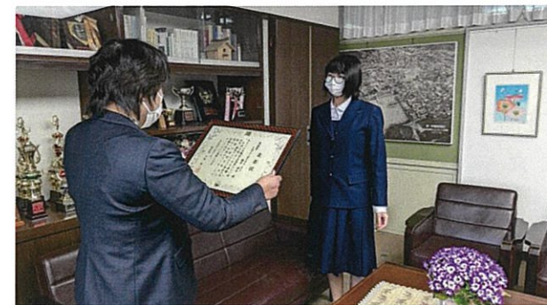
己斐中学校校長室にて校長先生から表彰状授与