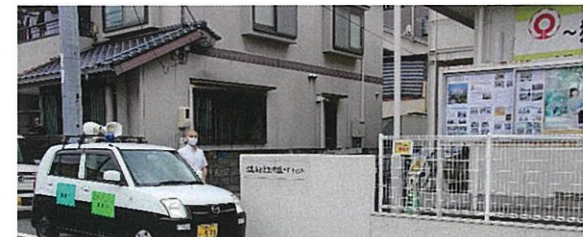
西区広報車による社明啓発(サポートセンター前)7/5