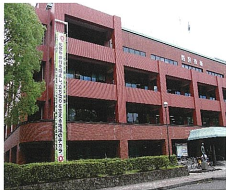
懸垂幕掲揚(西区役所)7月