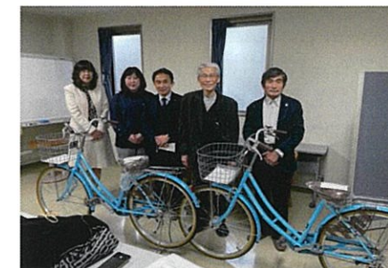
ウィズ広島へ自転車の寄贈(協力組織部)12/17